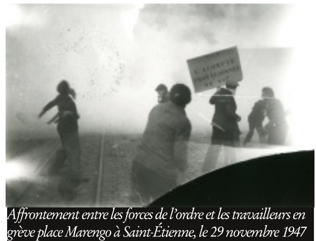
Affrontement entre les forces de l'ordre et les travailleurs en grève place Marengo à Saint-Étienne, le 29 novembre 1947

Qu'on se le dise, les droits « démocratiques » ne sont jamais des victoires prolétariennes, mais toujours des armes de la bourgeoisie. Qui essaiera toujours de nous amadouer avec des miettes : le droit de grève, la liberté d'expression, toujours en accord avec les intérêts de la nation bien entendu. Si une force populaire et contestataire émerge, comme les GJ, et tente de remettre en cause la dictature capitaliste, l'état démocratique montre alors son vrai visage. Mais tant que cette dictature se maintient, alors elle montre son doux visage en se présentant comme le garant des libertés publiques et des droits, à condition que le citoyen s'y plie sans discuter.