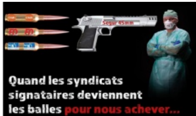
Visuel emprunté au Collectif Inter-Urgences

Enfin, cet « accord » prévoit de « simplifier » les fiches de paie en fusionnant toutes les indemnités : « Les parties au présent accord conviennent qu'une rénovation du régime indemnitaire des personnels