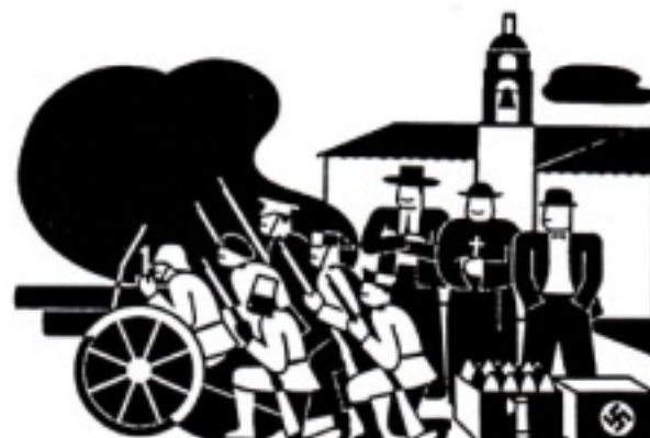
Spanien rechts 1936 (droite espagnole)