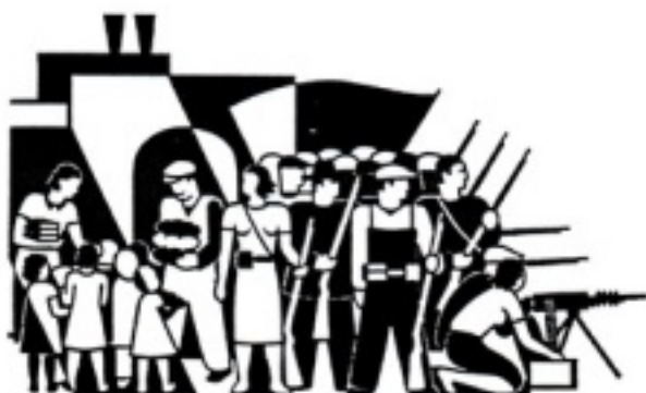
Spanien links 1936 (gauche espagnole)

(2) - Sur les ravages du Lean management, cf. LEAN management et toyotisme, où l'esclavage moderne et scientifique, COMITE D'USINE, numéro 4, https://cnt-ait.info/2024/12/17/comite-dusine4