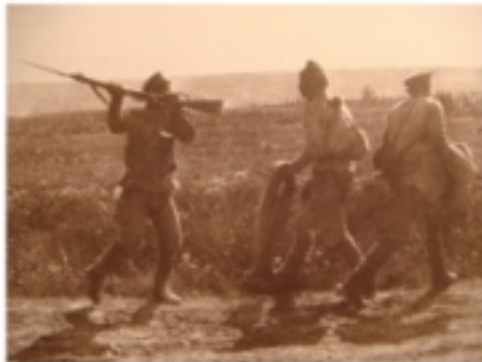
Arrestation de deux soldats russes déserteurs, 1917