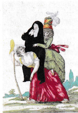
A. Joubert - Copier y en ce par la France honte.